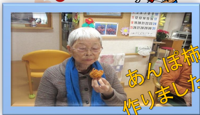
あんぽ柿 作りました!